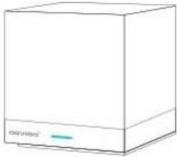
Cubo magico x1